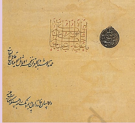
चित्र 7 नूरजहाँ का फ़रमान

बाईं ओर दिया गया दस्तावेज़, नूरजहाँ द्वारा जारी किया गया आदेश (फ़रमान) है। चौकोर मोहर बताती है— 'उदात्त और महान महारानी नूरजहाँ पादशाह बेगम का आदेश'। गोल मोहर के अनुसार, 'शाह जहाँगीर के प्रताप से महारानी, चन्द्रमा जैसी वैभवशाली बन गई: हम कामना करते हैं कि नूरजहाँ पादशाह इस युग की सर्वोत्तम महिला बने'